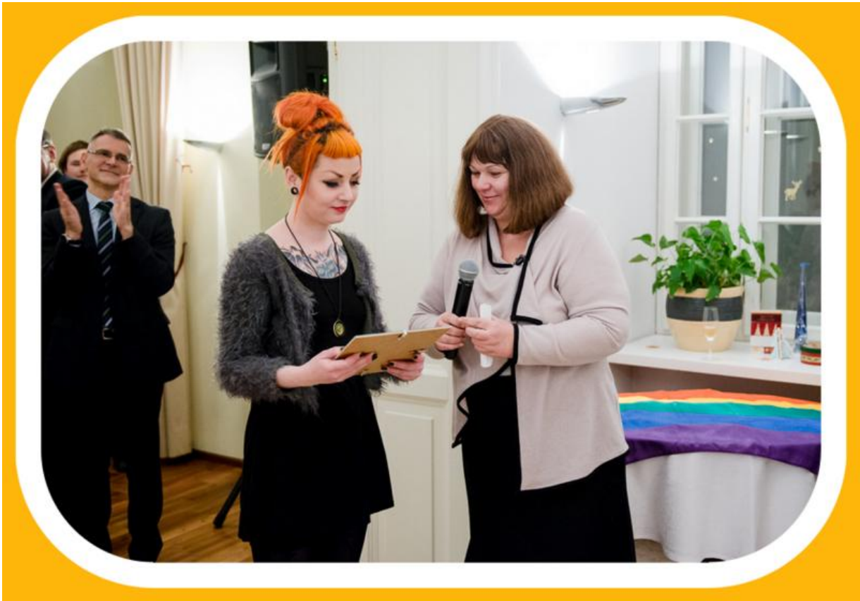
Austrijos ambasadoje Vilniuje pirmą kartą apdovanojome LGBT draugiškas organizacijas!